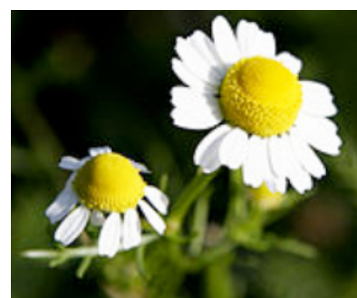
Camomille matricaire (calmante)