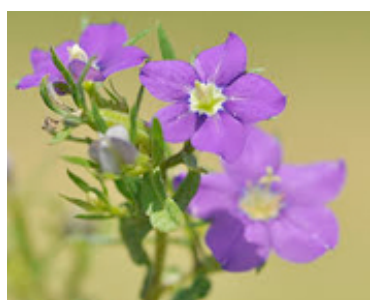
Miroir de Vénus