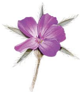
Nielle des blés (protégée)

Vous pouvez admirer les fleurs suivantes dont certaines, devenues rares, sont protégées.